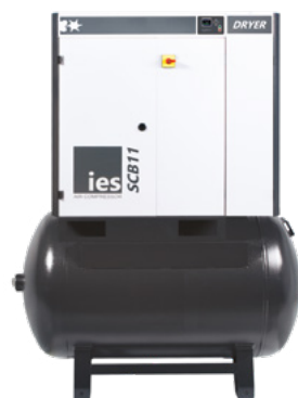
BASISVERSIE MET DROGER EN TANK