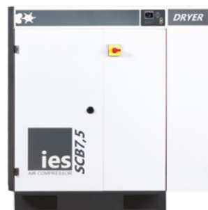
BASISVERSIE MET DROGER