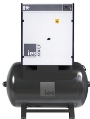
BASISVERSIE MET TANK